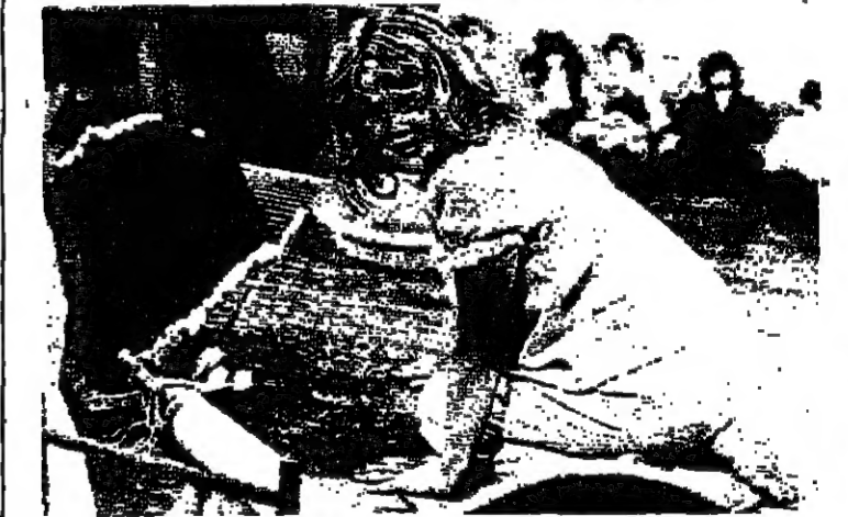
درو باريمور تخبيل اشباحا في غرفتها الصغيرة

الحبة الاخيرة في عقود درو، اسمها املندا، وهي على راس قائمة ممثلي الموسم، وصف ان المنتج ديدو لوريتس، سينتكريست - اخرج ستيفن كينج تخيلاً من القطعة، للصغيرة املندا، التي تلعب دور البطولة فيه. حكاية الفيلم تدور حول قصة فتاة صغيرة، تصيها لولة الربيع من حيوان شبيه يعيش داخل جدران غرفتها. وفي الليل، يخرج الحيوان من الجدران ويحس انفسها. لهذا تعيش املندا، في دائرة الضلم المستر. و ذات يوم كتلت قطة تنظر الى واجهة محل كبير. ورجاء ظهرت املندا وسط العراضات، وصرخت، ابتها القطعة، سارعي الى جديتي، انه يحاول الوصول الي.